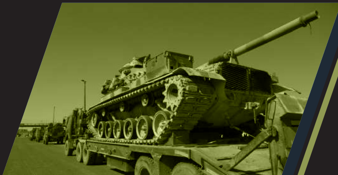
Военная техника, оборудование, «ГОЗ»