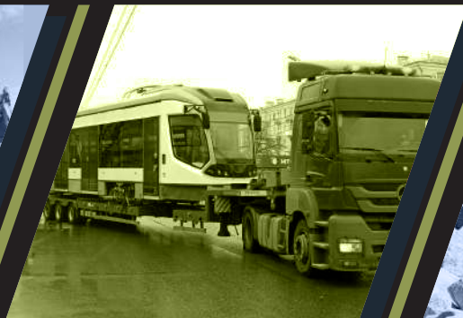
ТС специального назначения: трамваи, троллейбусы, автобусы