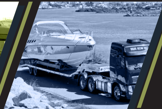
Частные перевозки: катера, яхты и прочее